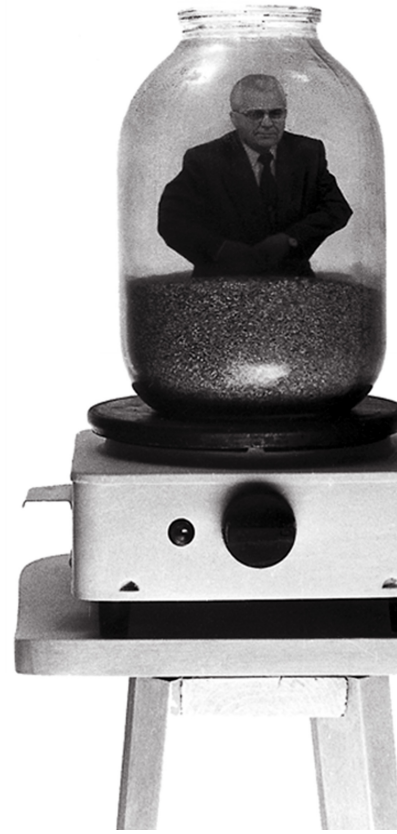
Матеріали надано авторами