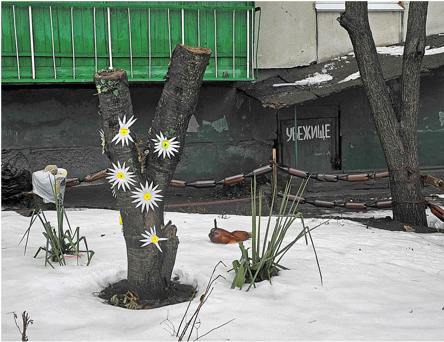
Всі фотографії зроблені учасниками експедицій ДЕ НЕ ДЕ в Лисичанську, Сєверодонецьку, Рубіжному, Святогірську та Попасній.